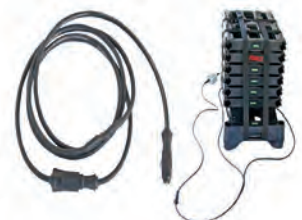
Y-Ladekabel Artikel-Nr.: 99366