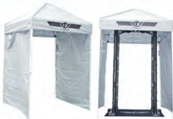
Wetterschutzdach Artikel-Nr.: 99366