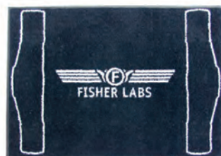
Fußmatte Artikel-Nr.: 99345