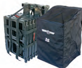
Transportschutz Artikel-Nr.: 99346