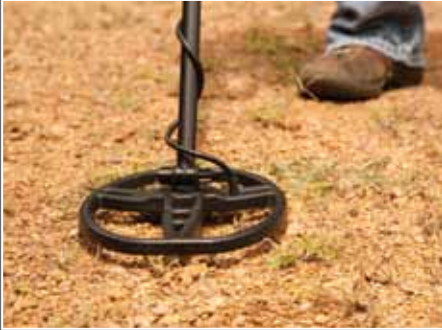
Neue DD-Sonde bietet bessere Ortungstiefe auf mineralisierten Böden.